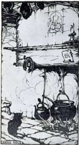
Vlaamsch Dagblad-Amsterd. naar een tekening van Anton-Park. Het wete hekje van Lekkand.

voor om rugwaarts over tientallen pinnen gesleept te worden. Ook pijnlijk is het om de behandeling in psychisch opzicht te moeten ondergaan. Als slachtoffer word je flink uitgeplozen; alle oneffenheden in gedrag en persoonlijkheid worden ontrafeld. Zelfs zonder dat je er zelf bij bent!