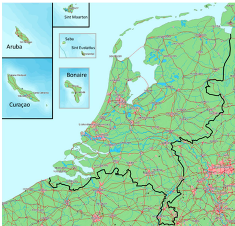
Kaart met de delen van het Koninkrijk op dezelfde schaal

Op grond van artikel 38 van het Statuut functioneert op het terrein van wetgeving en bestuur tussen de landen Curacao, Sint Maarten en Aruba een samenwerkingsregeling. De regeling is per 1 januari 1986 in werking getreden. In dit verband is onder meer een 'ministeriële samenwerkingsraad' uit deze landen ingesteld. Ook hebben de drie landen een Gemeenschappelijk Hof van Justitie en sinds 1996 een Kustwacht van de Nederlandse Antillen en Aruba.